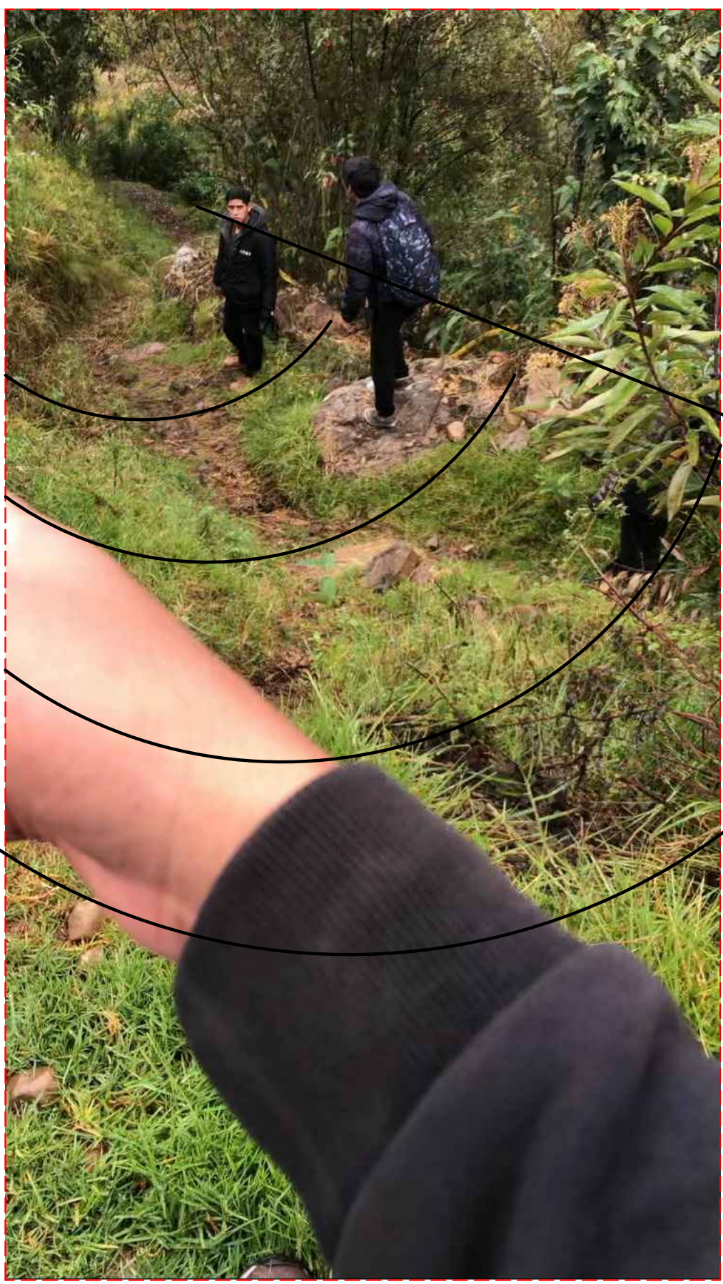
21.- AMPLIAR RECIBIDOR PARA EL PUENTE 2DA ZONA DE TRABAJO GRANDE